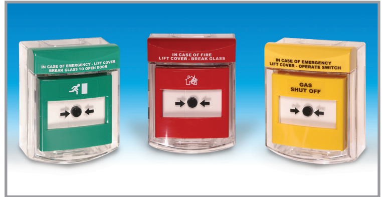
Una gama de colours disponibles

EJEMPLO STI-6931-G/ESP = Call Point Stopper verde, para pulsadores de superficie, con separador de superficie NOTA: El Call Point Stopper es suministrado en rojo y con las instrucciones operativas: 'EN CASO DE EMERGENCIA LEVANTAR LA TAPA Y HACER FUNCIONAR EL INTERRUPTOR.' Diferentes opciones de texto disponible o personalizado