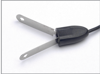
Pince en acier (KIT-131)