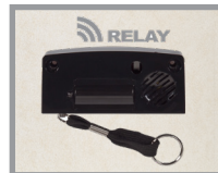
Option sans fil