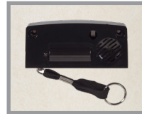
Alarme intégrée en option