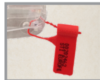
Fonction anti-effraction Option d'installation gauche ou droite