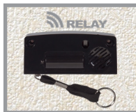
Conexión inalámbrica opcional