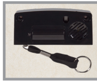
Sirena integral opcional