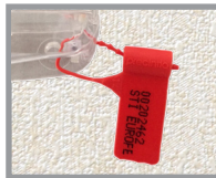
Precinto de protección (opción de instalación en el lado izquierdo o derecho)